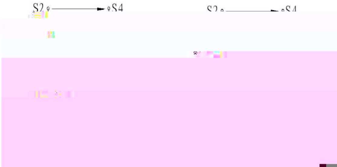
图3、旋转变压器原理图