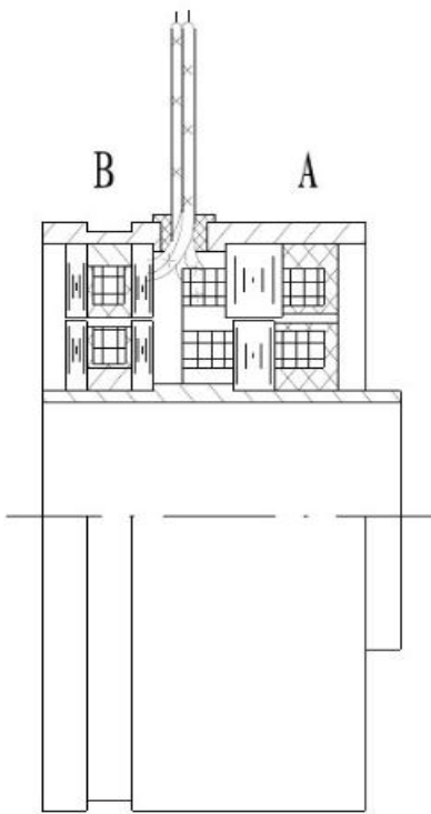
图 1、环形变压器式旋变结构示意图